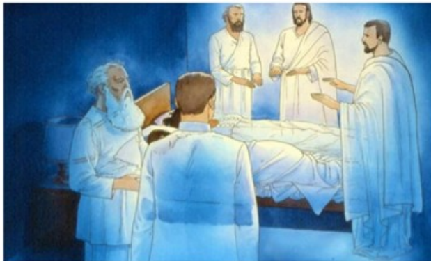
Sob o influxo magnético dos Construtores Espirituais, a forma reduzida de Segismundo é ajustada ao útero materno, terminando, assim, a operação inicial de ligação do processo reencarnatório.