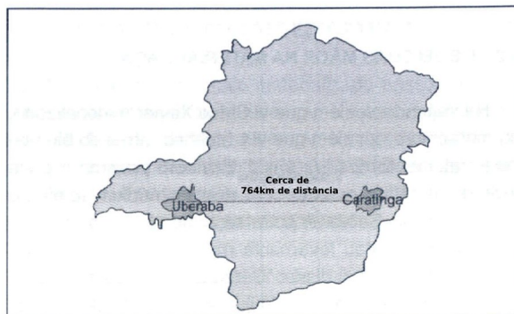
Mapa de Minas Gerais