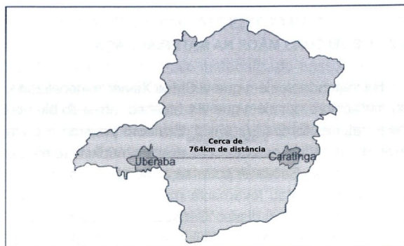
Mapa de Minas Gerais