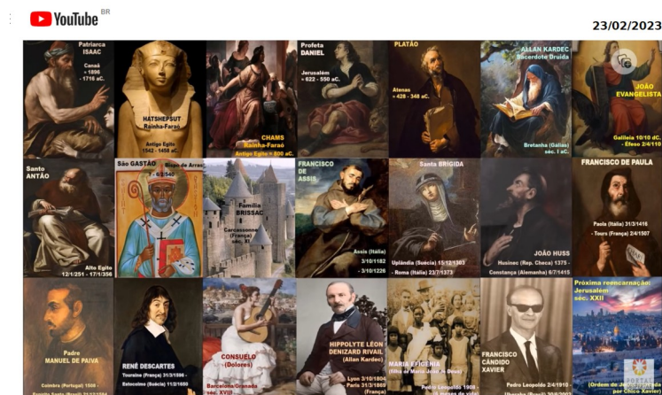
20 REENCARNAÇÕES de CHICO XAVIER - cenas da Vida Eterna deste Espírito Mèdium de Jesus

Eis uma imagem da lista constante no vídeo “20 Vidas de Chico Xavier”, postado em 14/09/2020 na página Portal Despertar , no YouTube (26) :