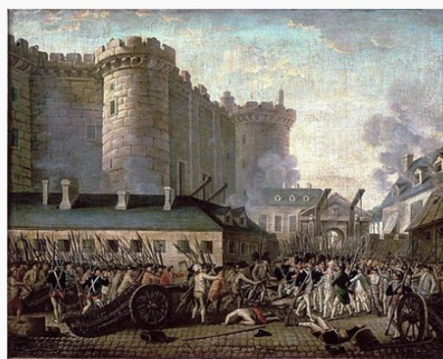
Queda da Bastilha em 14 de julho de 1789.

Revolução Francesa (em francês: Révolution française , 1789-1799) foi um período de intensa agitação política e social na França, que teve um impacto duradouro na história do país e, mais amplamente, em todo o continente europeu. A monarquia absolutista que tinha governado a nação durante séculos entrou em colapso em apenas três anos. A sociedade francesa passou por uma transformação épica, quando privilégios feudais, aristocráticos e religiosos