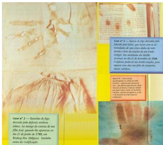
Revista Visão Espírita nº 4, Salvador: Seda, julho/1998, pp. 12-15.

preces, e para provar que voltaram mesmo deixaram suas marcas: