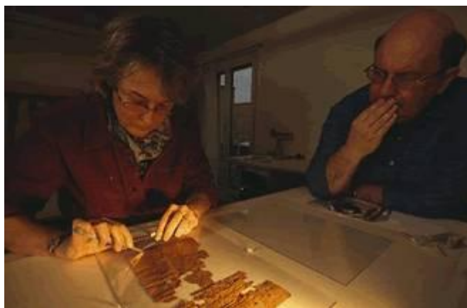
Momento da verdade

Técnicas de iluminação: Refletores para luz do dia