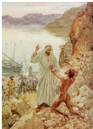
Jesus exorcizando o geraseno

“Navegaram em direção à região dos gerasenos, que está do lado contrário da Galileia. Ao pisarem terra firme, veio ao seu encontro um homem da cidade, possesso de demônios . Havia muito que andava sem roupas e não habitava em casa alguma, mas em sepulturas. Logo que viu a Jesus começou a gritar, caiu-lhe aos pés e disse em alta voz: ‘Que queres de mim, Jesus, filho do Deus Altíssimo? Peço-te que não me