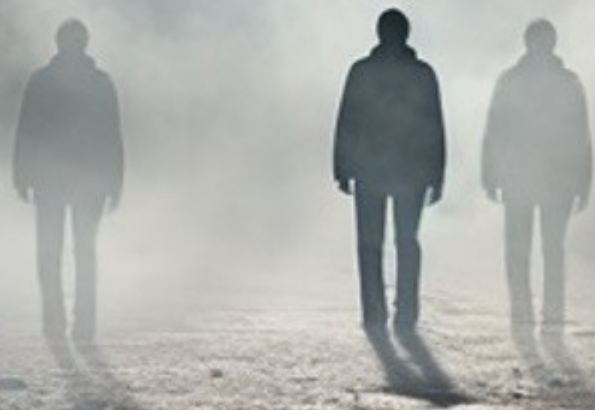
IMAGEM: JBatista - Midjourney