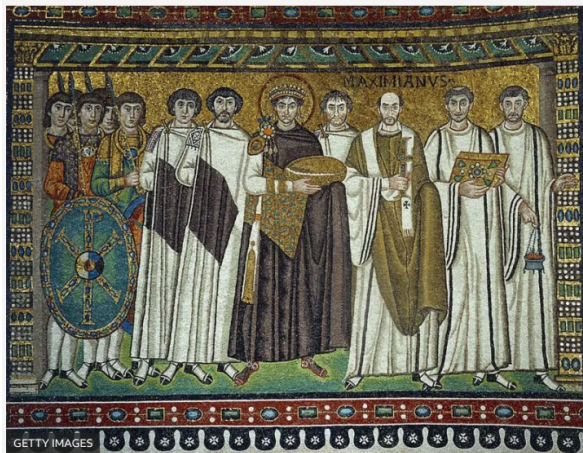
Justiniano sonhava em reconquistar as terras do Império Romano do Ocidente

E ele usou esse poder para criar uma narrativa completamente nova, na qual o gênero e a classe tinham um papel menor do que a ambição e a capacidade.